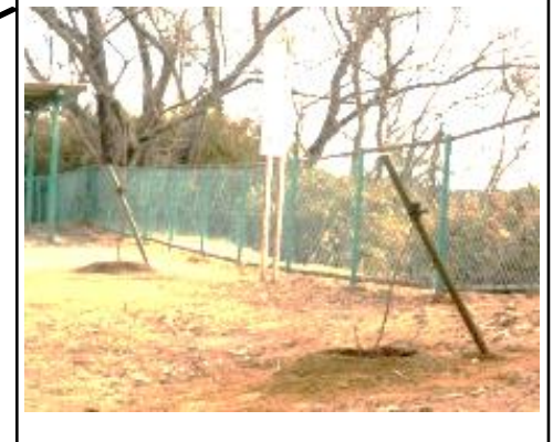
②ふれあい広場・・・9本