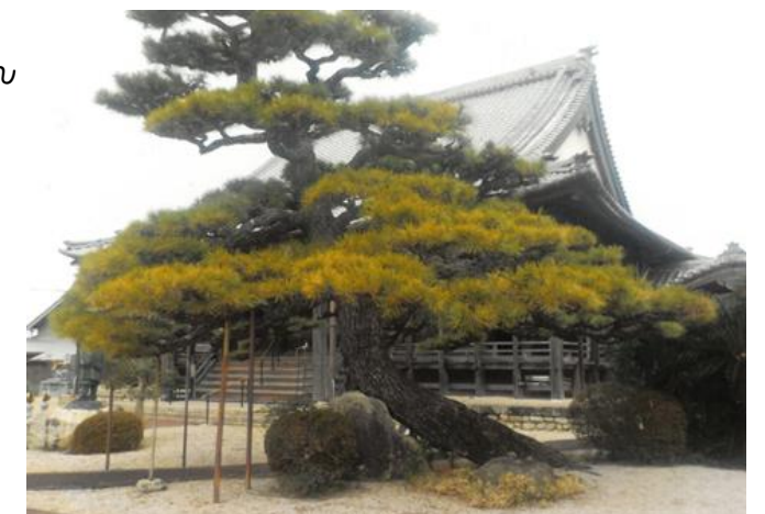
(文責 竹内 勇)