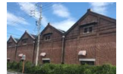
赤レンガ棟 (富州原町)

文化財を火災や震災などから守るためには、文化財の関係者、消防機関、地域のみなさんが一体となって、火災予防の環境づくりや防災体制の整備に努めることが大切です。