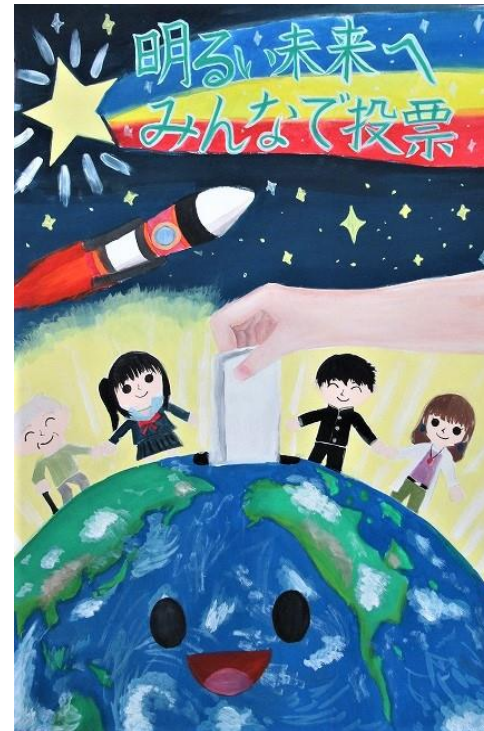
稲垣 琉花 さんの作品