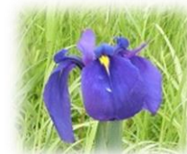
ノハナショウブ (5月頃)

TEL 354-8238 Eメール： syakaibunkazai@city.yokkaichi.mie.jp