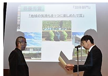
表彰を受ける毛利会長

12月2日(土)にグリーンカーテンフォトコンテスト表彰式が、じばさん三重で開催され、次の団体が、団体部門で最優秀賞に選ばれました。八郷地区市民センターに植えたゴーヤの苗は、見事なグリーンカーテンに成長し、夏の強い日差しをやわらげてくれました。受賞おめでとうございます。