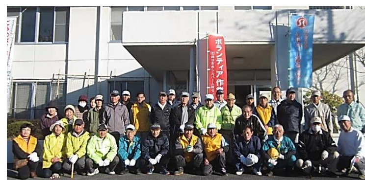
作業をしていただいた、シルバー人材センター会員のみなさん

12月2日(土)八郷地区にお住まいのシルバー人材センター会員のみなさんにボランティアとして、八郷地区市民センターの樹木の選定・除草作業をしていただきました。たいへんきれいになり、ありがとうございました。