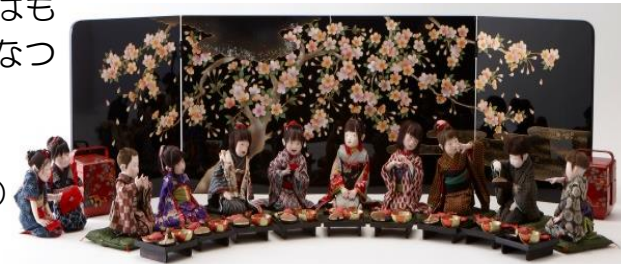
水澄美恵子 作「めでたい日」 （制作2007年）